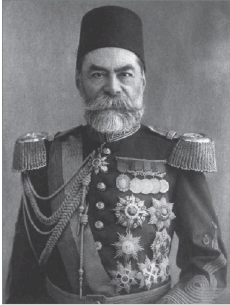
الوالي التركي أحمد باشا

ويصدق هذا التشخيص على مواقف الجبرتي السياسية من الحكم المملوكي، التي كانت في مجملها نقدًا للظاهرة من داخلها، لا يتجاوز الطموح إلى الانقلاب عليها أو الرفض الكامل لها.