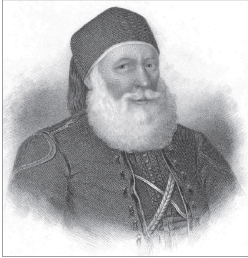
محمد علي باشا

ولأن التاريخ عند الجبرتي هو تحقيق لإرادة عليا لا يملك الإنسان الفكاك منها، وكل ما حدث له من مظالم هو انتقام سماوي لخروجه عن الناموس، فقد كان طبيعياً أن ينظر إلى التكوين الاجتماعي باعتباره خاضعاً لتركيب طبقي حديدي، يخضع فيه الصغير للكبير، والدنيء للشريف، والأدنى للأعلى. في هذا الصدد يبدو الجبرتي أكثر تزمناً من أي شيء آخر، فكل شيء لا يداني عنده الإخلال بالتصميم الاجتماعي المستقر. فعلى الممالك أن يتبعوا تقاليدهم تجاه أمرائهم، فإذا ما خرجوا عنها أثاروا غضبه. وهو يرى أن من الأحداث التي تستحق الرواية أن الممالك قد تزوجوا «وصار لهم بيوت وخدم، ويركبون ويغدون ويروحون ويشربون الدخان وهم راكبون في الشارع الأعظم وفي أيديهم شبكات الدخان من غير إنكار وهم في الرق ولا يخطر ببالهم خروجهم عن الأدب لعدم إنكار أسيادهم وترخيصهم لهم في الأمور» (١٠٦).