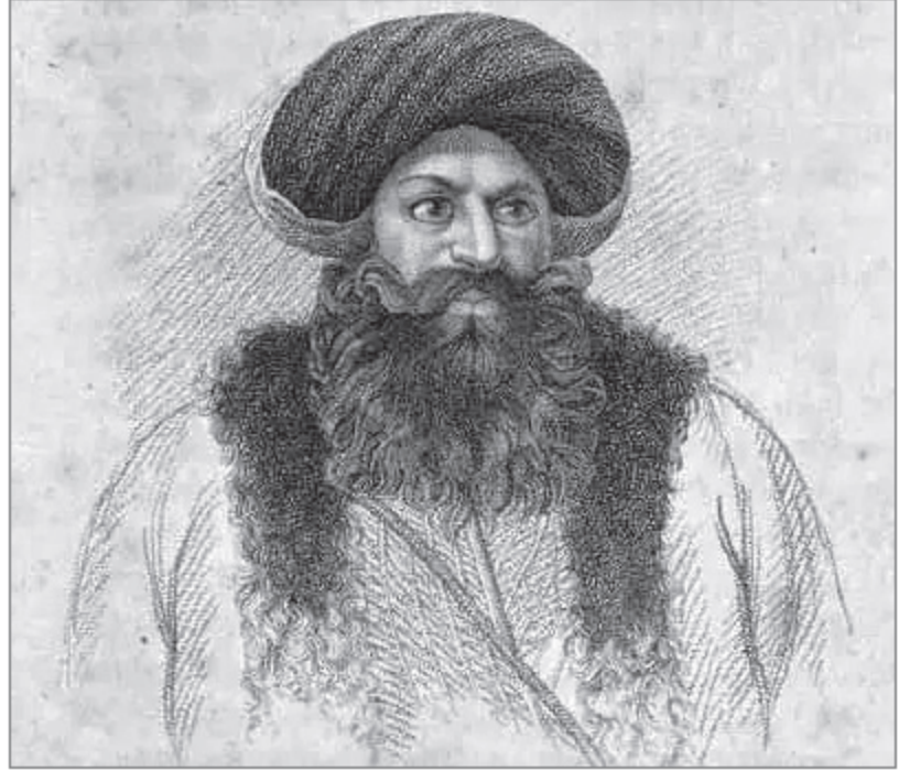
محمد بك الألفي

والفكرة التي جاء بها الألفي - بعد عام من الإقامة في إنجلترا - مظهر من مظاهر الاختلاف بين فكر «الصناعي» مستغل العصر الحديث، الذي يخضع نفسه إلى درجة أرقى من التنظيم في معاملته لمن يستغلهم، فيضرب إذا ضمن أن الضرب يزيد الربح، ويربت إذا تبين العكس، وبين فكر «الأرستقراطية العسكرية المملوكية» الفاقدة لأي ذكاء استغلالي والتي تدمر الدجاجة التي تبيض لها الذهب. على أن هذا التأثير الشديد بأعلى درجات الوعي الذي قاد خطوات البرجوازية الأوروبية في صعودها للسلطة لم يكن له امتداداته في شخصية الألفي نفسه - الذي مات قبل أن يحقق حلمه - بينما وجد مع تأثيرات أخرى - وبنمط مختلف - الفرصة للتحقق نسبيًا في ظل حكم محمد علي (٣٩).