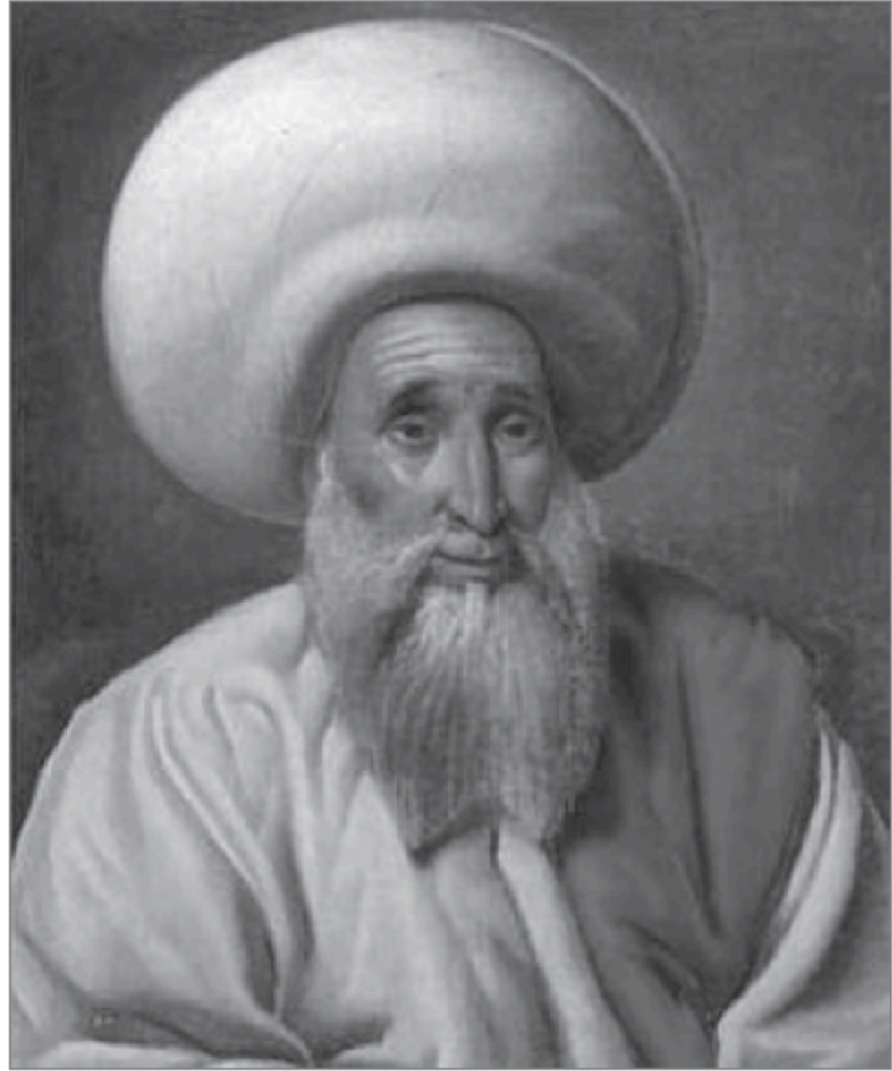
شيخ الأزهر عبد الله الشرقاوي

متضمنًا لواقعة الحال المذكور»(٤٩). وهو ما يعني أن التفكير في التأليف عن الحملة يرجع إلى شهر رمضان سنة ١٢١٤هـ (يناير - فبراير ١٨٠٠م)، وهو الشهر الذي قابل فيه العلماء الصدر الأعظم، ولم يذكر الجبرتي - سواء في «مظهر التقديس» أو في «عجائب الآثار» - أنه كان بين أعضاء الوفد الذي سافر إلى بلبس للسلام عليه(٥٠).